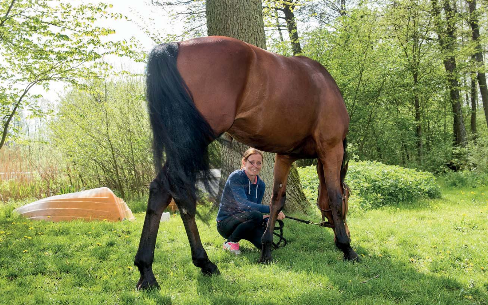
Elitloppshäst för tredje året i rad