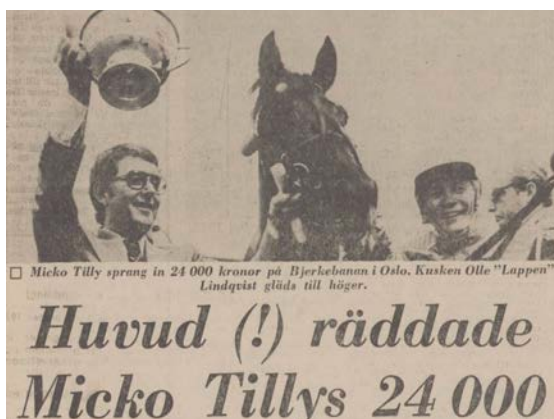
Faksimil från Dagens Nyheter.