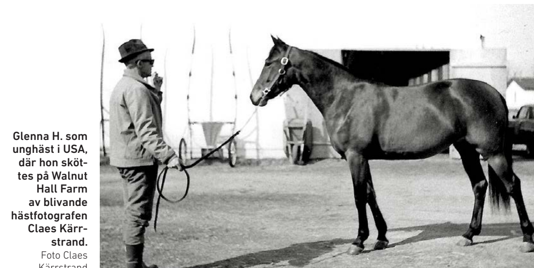
Glenna H. som unghäst i USA, där hon sköttes på Walnut Hall Farm av blivande hästfotografen Claes Kärrstrand.