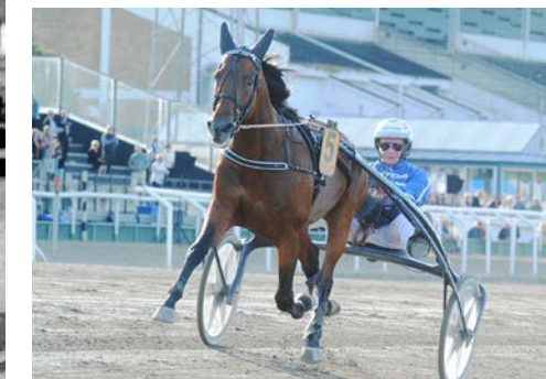
Calgary Games.

Mormors mormors mormor till: Mousse (e. Gallant Baron), 1.11,4ak/2.218.193 kr Pascha Tilly (e. Ready Cash), 1.12,7ak/1.563.151 kr