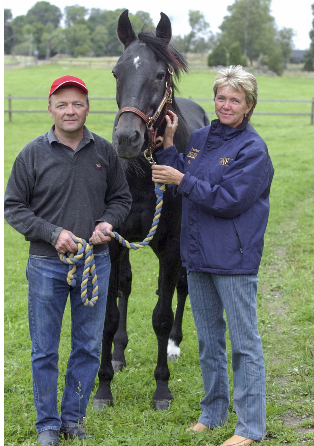
Meadow Road levde sina sista år hemma hos Torbjörn och Eva. Här är hingsten 26 år gammal 2005 och i full form, men året efter fick han problem med tänderna och fick lämna jordelivet.

– Meadow Road fick vara här några år, men