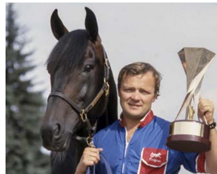
Segeberucklan från Statue of Liberty Trot.

– Alla delägarna utom jag sålde. Jag behöll min sjättedel i Meadow Road. Han syndikerades i USA och priset för hans tjänster var 6.000 dollar. Han var ju den första svenskfödde avelshingsten som exporterades till USA