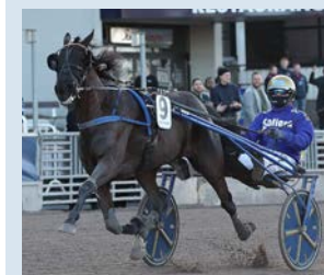
Betting Pacer.